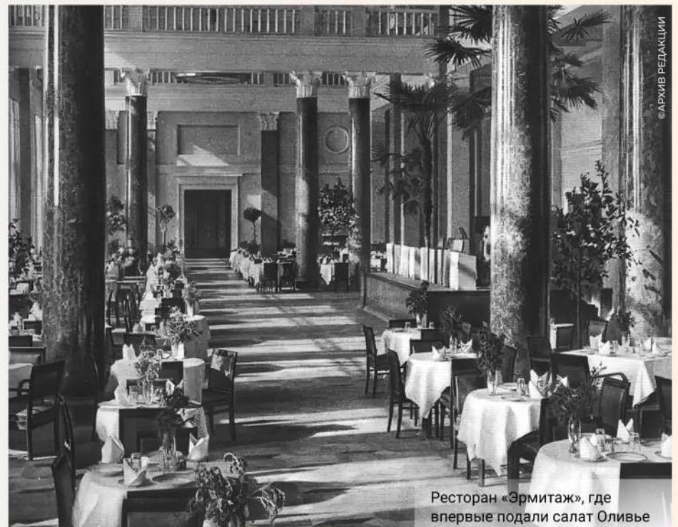
Ресторан «Эрмитаж», где впервые подали салат Оливье

Обратили внимание, что пока всё обходится без маринованных или солёных огурчиков?